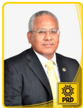
Dip. Jocías Catalán Valdéz.

“2013. Año del Bicentenario de los Sentimientos de la Nación”